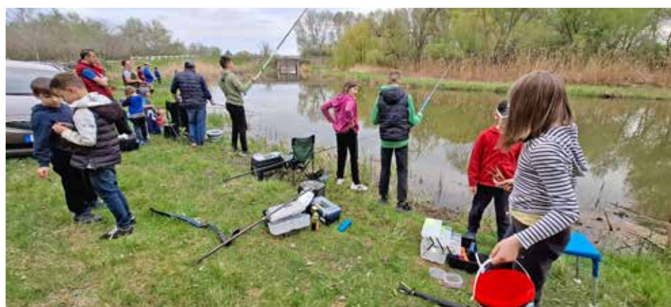
Dömsödi árapasztó csatorna