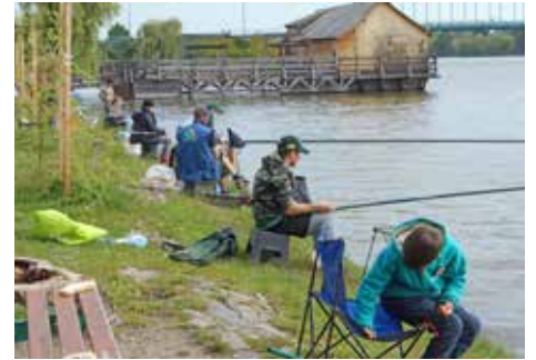
Gyermek egyesületi horgászverseny