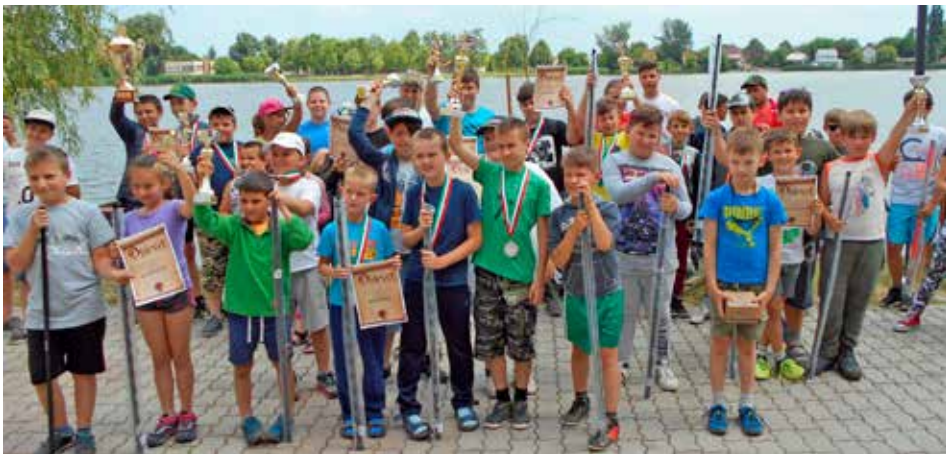
Általános iskolák horgászversenye díjkiosztó